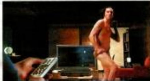
Si, dans le clip publicitaire de Naxoo, des hommes s'effeuillent, l'offre, elle, s'étend.

MULTIMÉDIA. Dans 18 à 20 mois, les Genevois auront accès au service triple play (télévision, téléphonie et internet haut débit). Le conseil d'administration de Télégenève (Naxoo) a décidé de conclure un partenariat avec Cablecom pour moderniser son téléseuil et mettre à la disposition de la population cette offre combinée. Il est prévu que les premiers ménages soient équipés au début 2007 et que les travaux soient terminés un an plus tard. La Ville de Genève demeure actionnaire majoritaire (51%) dans cette opération. L'objectif est de parvenir à la mise en place d'une grande fédération des