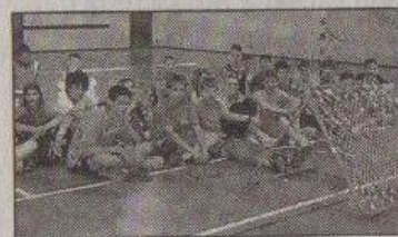
Les collégiens ont accroché !