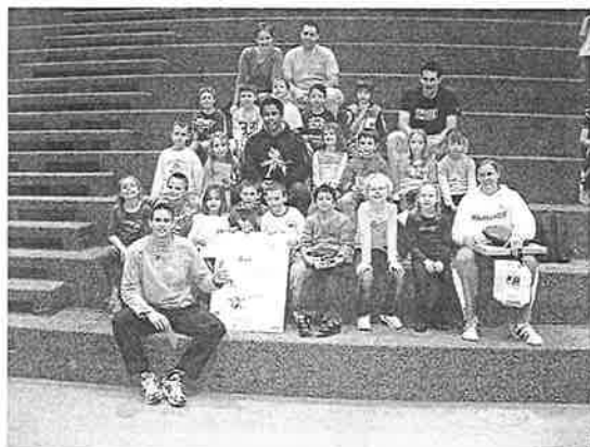
La classe vaudoise avec ses maîtres et quelques stars

A l'avenir l'école bougera toujours, puisqu'en mai une telle journée sera reconduite pour récompenser les classes inscrites entre août 2006 et juin 2007. En parallèle le SEPS tirera au sort une classe vaudoise pour la féliciter de ses efforts. Plus de temps à perdre, faites un tour sur le site http://www.ecolebouge.ch/ et encouragez des classes à s'y inscrire !